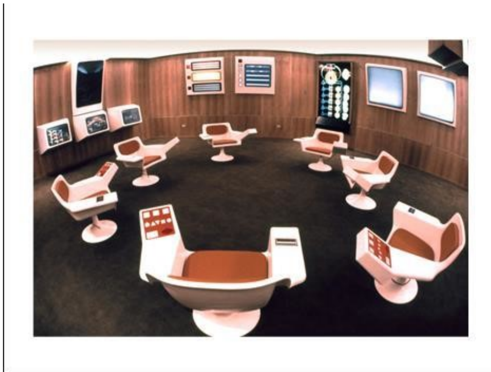
Figura 2 – Sala operativa di Cybersyn

Particolare attenzione era stata dedicata alla sua ergonomia e alla interfaccia uomo-macchina, al fine di migliorare il processo decisionale. La sala disponeva di diversi schermi, con l'intento di fornire informazioni significative e proiezioni sui cambiamenti negli indici di performance ritenuti rilevanti. Ulteriori informazioni erano fornite attraverso proiettori di diapositive controllati direttamente dai manager dalle proprie poltrone. Inoltre, la stanza disponeva anche di due schermi per proiettare i risultati di CHECO e delle discussioni inerenti la dinamica del sistema oggetto di analisi e il suo comportamento a lungo termine. Le decisioni che emergevano dalle conversazioni nella stanza potevano infine essere trasmesse via telex (ovvero Cybernet) alle unità interessate.