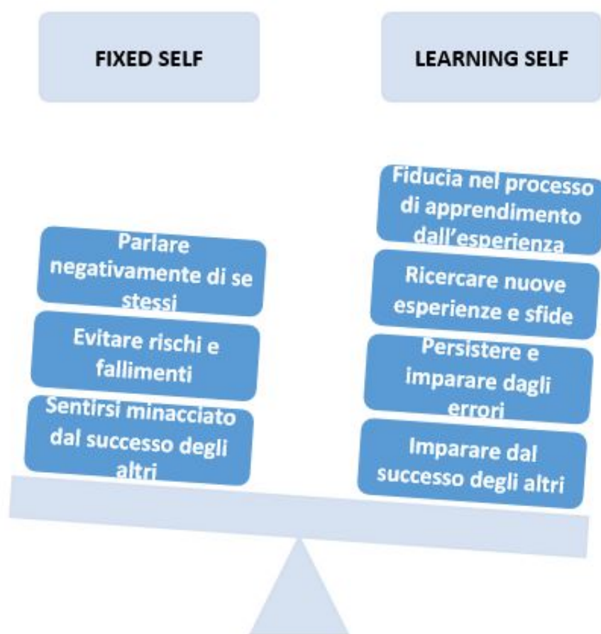
Figura n. 2 – Divenire un “Learner”