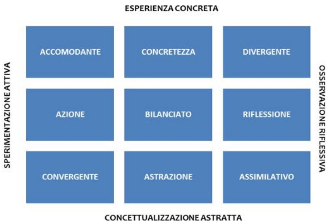
Figura n. 3 – I nove stili di apprendimento”

Ciascuno stile presenta proprie peculiarità, punti di forza e debolezza. Essi vanno considerati e analizzati secondo una logica situazionale.