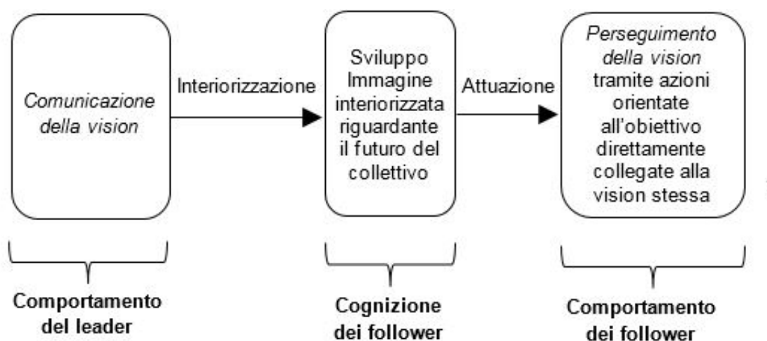
Fig. 3 Il modello generale di comunicazione della vision proposto da Stam e colleghi